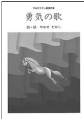
やなせたかし童謡詩集「勇気之歌」 フレーベル館

ふとした時に想い出す 心に残った詩 懐かしい詩 遠いかなたに思いをよせて ちょっと詩一たいもしませんか