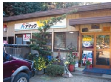
元気なアマック社の外観