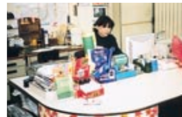
“じょうでき”で事務もラクラク

帳簿の整理、家事と忙しく、夜1人でもくもくと帳面付け、もう少し自分の時間が欲しく、パソコンを導入しました。ビデオの予約も子供まかせの私でも出きるか不安でしたが、インストラクターの方達のおかげで今はエクセル、ワード、筆まめ等も使えるようになり、POPづくりから送り状、のし紙、価格票いろんな使い方ができるようになりました。