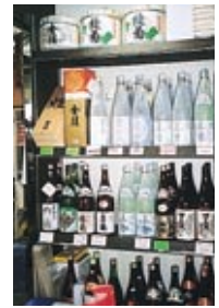
地酒が豊富な品揃え