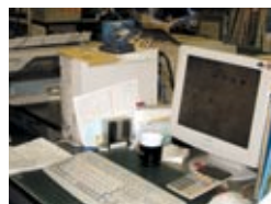
活躍する“じょうでき”

その他にも、つい見逃しがちだった少額の売掛金の回収もれのトラブルを解消。(ち先積もれば山となります。) 印字された美しい伝票で当社のイメージアップに貢献、得意先からの信頼もさらに向上しました。