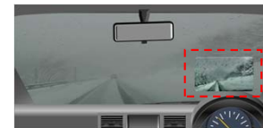
<ヘッドアップディスプレイ>

鮮明化映像について、フロントガラスへの投影を行う「ヘッドアップディスプレイ」を活用した表示を可能とします。これを利用することにより、運転者が走行しながら鮮明化映像を確認することを可能とします。